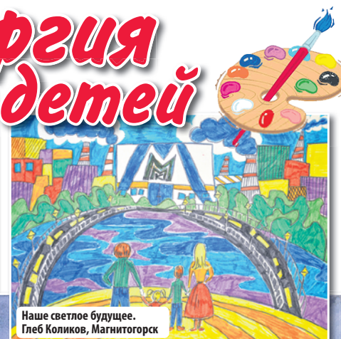
Наше светлое будущее. Глеб Коликов, Магнитогорск