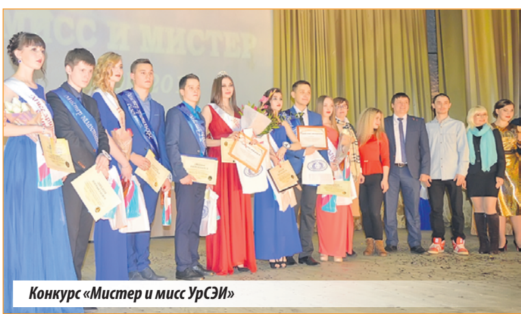
Конкурс «Мистер и мисс УрСЭИ»

Участие студентов в общественной жизни позволяет им раскрыть свои творческие способности, сделать студенческую жизнь яркой, интересной, насыщенной событиями. А дружба и студенческое братство останутся с ребятами на долгие годы, а иногда и на всю жизнь.